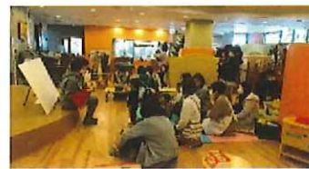
おはなし会：パネルシアター